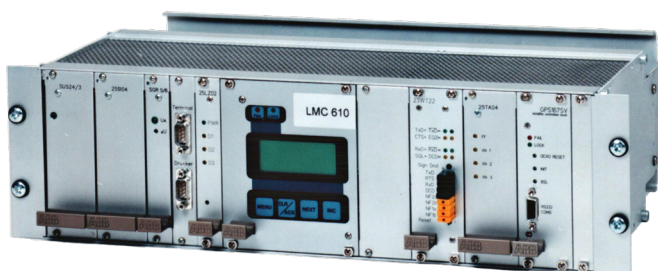
Lokale Steuereinheit LMC610